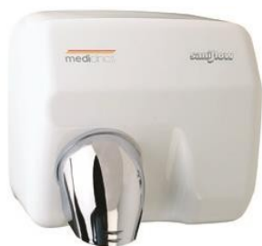
E05A Acabado blanco